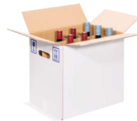
Article n° 34754