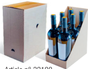
Article n° 32198 avec ouverture de présentation