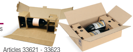
Articles 33621 - 33623

L'emballage le plus populaire pour l'expédition postale est maintenant disponible dans une conception avantageuse ! Ø 90 convient pour des longueurs de bouteilles de max. 325 mm et d'une contenance de 7 dl – 1 l. L'article 33621 peut contenir 1 bouteille de 5 dl jusqu'à 1 l.