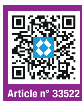
Article n° 33522

Découvrez le potentiel de cet emballage en 3D, directement depuis votre place de travail.