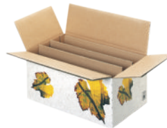
Article n° 34753