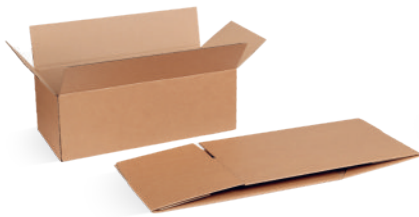
Article n° 34125