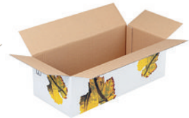
Article n° 34725