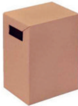
Article n° 32197 avec casiers