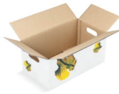
Article n° 34730