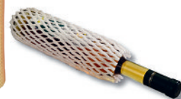
Article n° 31641