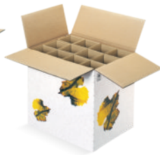
Article n° 34752