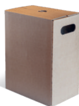
Article n° 32199 avec casiers