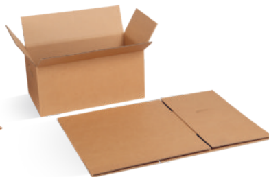
Article n° 34130