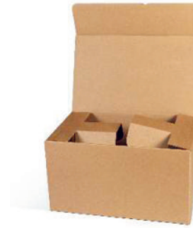
Article n° 31296

L'emballage de transport brun, blanc ou avec impression feuille de vigne témoigne de la qualité traditionnelle. Les pièces intérieures séparent et maintiennent les bouteilles fragiles et rendent ainsi un matériel de rembourrage supplémentaire superflu.